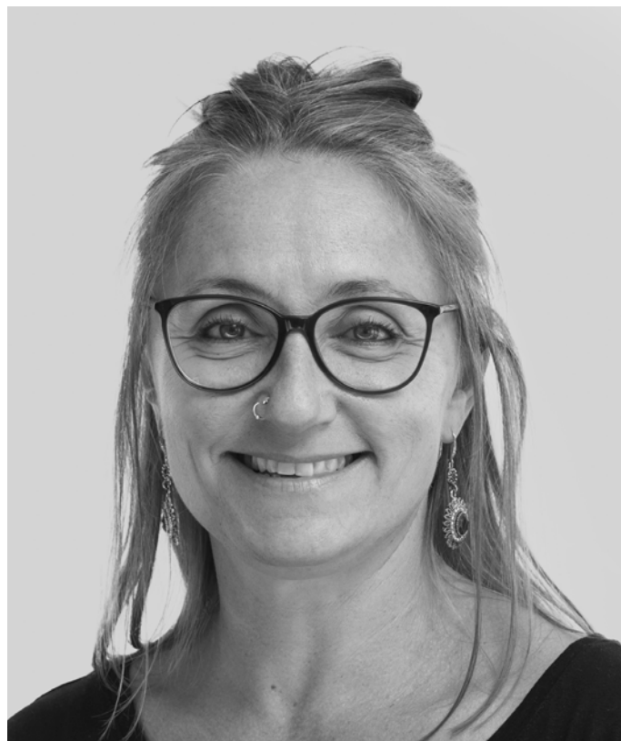
Infermiera di comunità

Questa figura è presente in Comune e sul territorio di Balerna il venerdì di ogni settimana ed è possibile raggiungerla attraverso il numero di cellulare 079 468 09 98 dalle 08.00-12.00 e dalle 13.30-17.30 oppure tramite l'email colombo@balerna.ch .